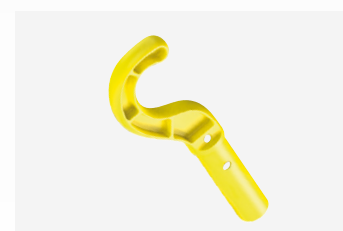
hak do usuwania z wody

Elektryczne odkurzacze basenowe wyposażone w baterię litowo - jonową są urządzeniami autonomicznymi, nie wymagają podłączenia do systemu filtracji. Czyszczą powierzchnie i zbierają zanieczyszczenia do własnego pojemnika filtra.