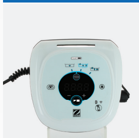
Zasilacz - jednostka sterująca